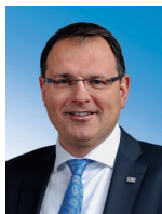
Albert Füracker, MdL Staatsminister